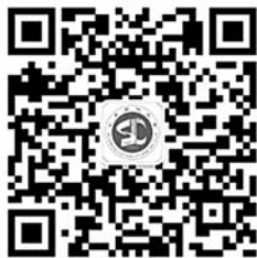
山东老年大学微信公众号

网上注册成功后,学员们需要携带身份证到现场进行实名认证和刷卡缴费。6月29日前未缴费及未到校进行实名认证的,自动取消入学资格。