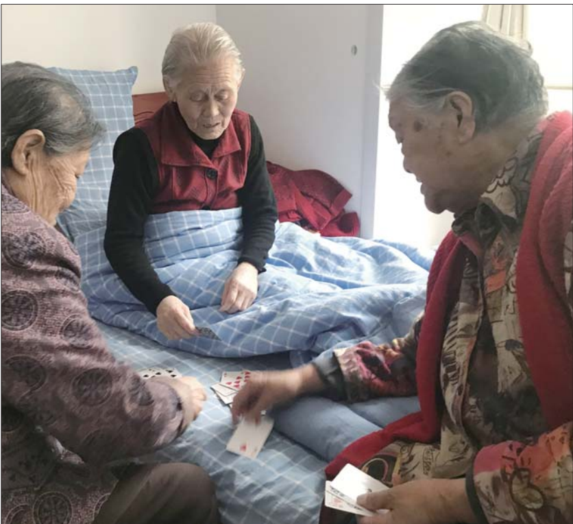
济南一家养老院的几位老人在打牌消遣。