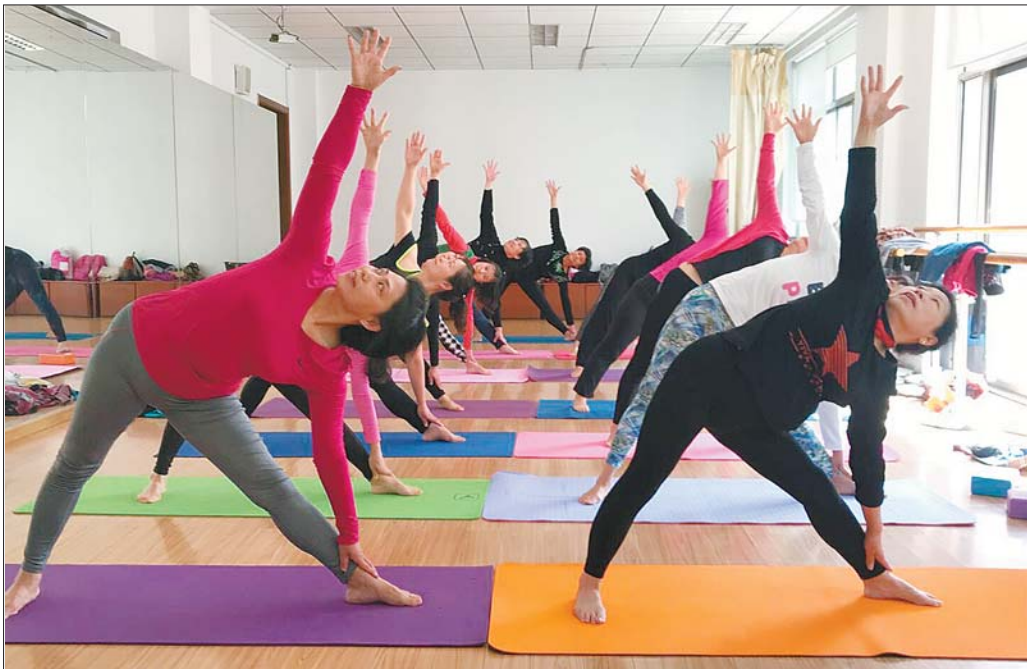
山东老年大学瑜伽班学员在教室练习瑜伽。

4月23日记者从山东老年大学获悉,该校秋季招生即将启动,现在就可预报名。有意愿的老年朋友需要先预报名,成功后再进行报名注册。需注意的是,预报名和报名注册全部网上进行。相关负责人介绍,具体招生简章和班级明细于5月中下旬在学校网站和微信公众号公布。今年新增文化馆校区,新校区计划招生1000余人。