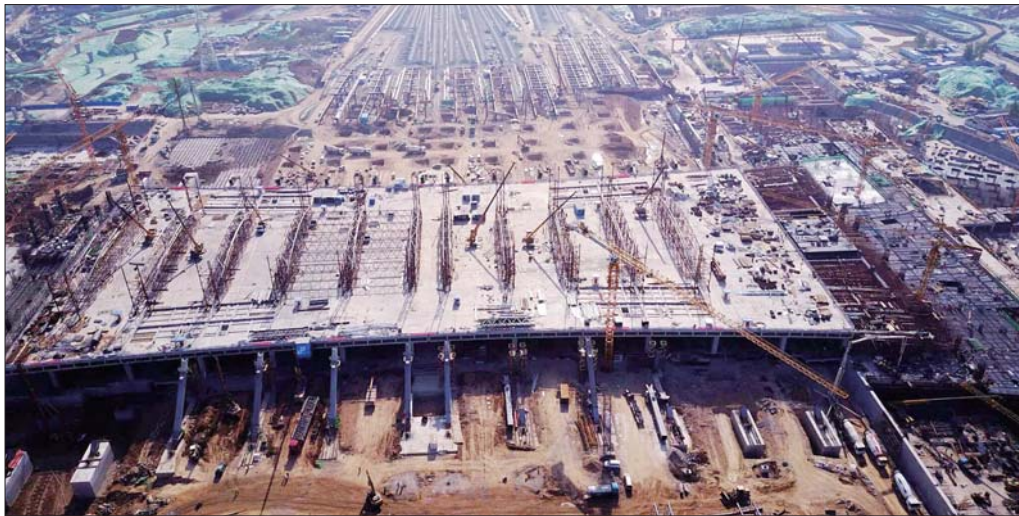
新东车站房正在建设中。

划了南华路、北华路、田园大道等18条道路,目前一期市政道路的建设工作正在加紧推进,计划9月份完成片区的市政道路建设。未来片区将承载更多的客流,因此,相关部门也在策划第二批市政道路配套,计划年底前基本完成。