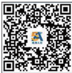
扫描二维码下载安装“威海人社”手机APP

入户认证。残疾、重病、高龄等行动不便的认证对象,其近亲属可以就近到区社保中心服务大厅、乡镇街道办事处社会保障服务中心申请入户认证。