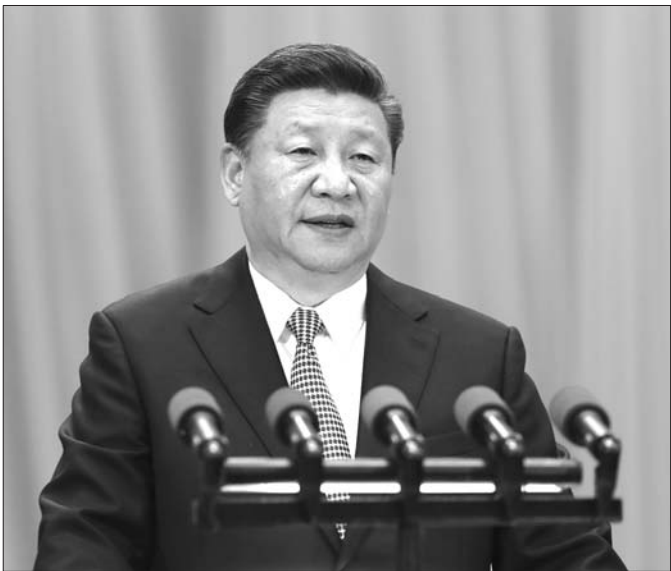
5月4日,纪念马克思诞辰200周年大会在京举行。中共中央总书记、国家主席、中央军委主席习近平在大会上发表重要讲话。

据新华社北京5月4日电 纪念马克思诞辰200周年大会4日上午在北京人民大会堂隆重举行。中共中央总书记、国家主席、中央军委主席习近平在会上发表重要讲话强调,新时代,中国共产党人仍然要学习马克思,学习和实践马克思主义,高扬马克思主义伟大旗帜,不断从中汲取科学智慧和理论力量,更有定力、更有自信、更有智慧地坚持和发展新时代中国特色社会主义,让马克思、恩格斯设想的人类社会美好前景不断在中国大地上生动展现出来。