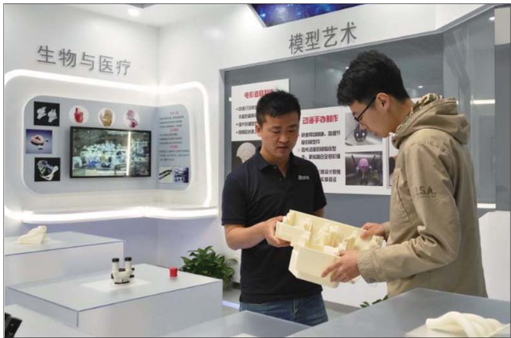
工业级的3D打印技术,制作出的模型精度更高。