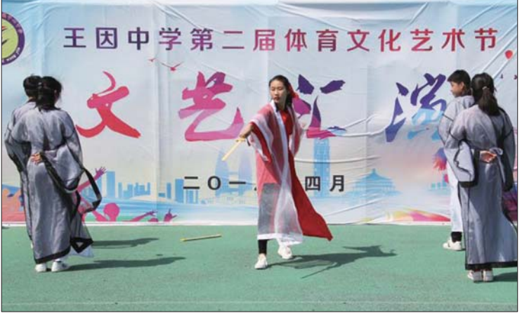
武术表演,节目精彩纷呈。