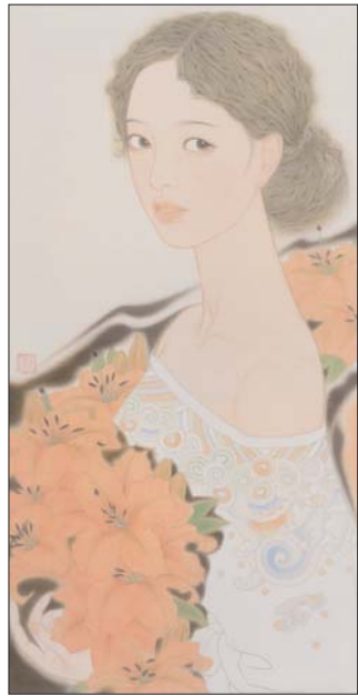
▲清尊素影 35x70cm 袁玲玲