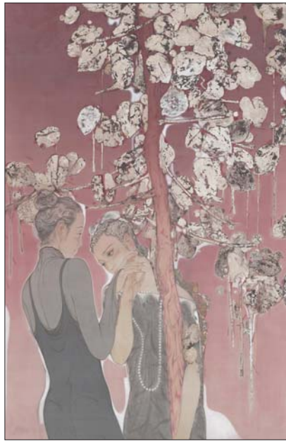
▲之间 120x80cm 杨斌

参展艺术家杨斌在接受采访时表示,“时代性是艺术的固有属性,当代的工笔画创作出现了多元融合的发展态势。让工笔画在美学观念和表现手法上,做到既继承传统的精华,又能够以当代人的审美意识、修辞方式去介入当代,表现我们的时代,是每个艺术家必须面对和解决的问题。这次展示、交流,对于我们八个人来说,是一次总结,也是一次重新出发。”(马茜)