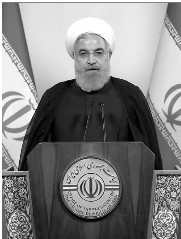
8日,伊朗总统鲁哈尼发表电视讲话。

为说服美国不“退群”,法德英先前提议修改协议,内容主要包括限制伊朗弹道导弹项目、限制伊朗在也门和叙利亚的影响力、加强国际核查、修改“日落条款”。根据“日落条款”,伊方在一定期限后可以恢复铀浓缩。不过,特朗普没有接受这一提议。