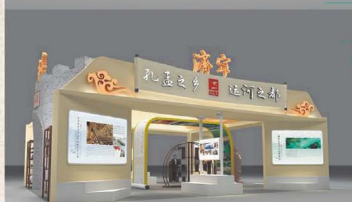
济宁特装展区效果图。