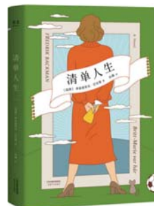
《清单人生》 [瑞典]巴克曼 著 天津人民出版社

本书是村上春树周游世界各地,写下的妙趣横生的旅行散文集。在遍布苔藓的冰岛,邂逅没有尾巴的羊和可爱的迷途之鸟;在梅雨季节去熊本,拜访夏日漱石的故事……不论怎样的旅行都充满了惊喜与意外,诸多的挫折都化为无穷的乐趣。这才是真正的旅行。