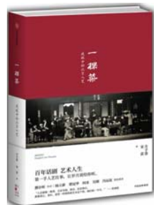
《一棵菜:我眼中的北京人艺》 方子春 宋苗 著 中信出版社

144种中国传统手工艺,199位真诚质朴的匠人,34300公里的行程……在拍摄纪录片《寻找手工艺》的过程中,作者走遍中国,与手艺人相遇,与普通人相遇,感受到了风景之美、传统之美、人情之美,不仅完成了寻找手工艺之旅,也完成了一次自我反省反思的心灵荡涤。