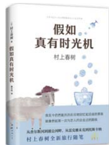
《假如真有时光机》 [日]村上春树 著 南海出版公司

1952年北京人民艺术剧院成立时,戏剧家焦菊隐提出了“一棵菜精神”:剧院好似一棵菜,菜根、菜心、菜叶、菜帮要紧紧团结在一起,不分主次,共同为了艺术而奋斗。本书展现了焦菊隐、欧阳山尊、吴刚、濮存昕等四十一位“人艺人”的艺术人生,一窥他们在舞台背后的悲欢离合。