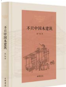
《不只中国木建筑》 赵广超 著 中华书局

赵广超曾在法国接受教育,在香港院校执教东西方艺术设计多年,由中西比较的视角,以感性的笔触,就一般被视为艰涩的传统建筑,写下16篇平易隽永的文章,章章引人入胜。赵广超介绍中国的建筑,以及蕴涵其中的中国传统文化,高妙之处在于,引领读者穿过深深庭院,登堂入室,一窥中国建筑的究竟,让读者了解中国建筑的元素、风格和结构,宫殿,寺庙,民居,园林,亭台楼阁,小桥木塔,一一看过来,如沐春风。