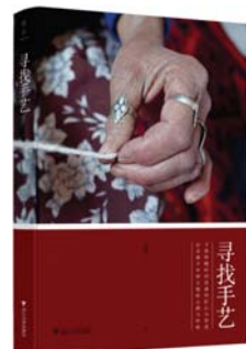
《寻找手工艺》 张景 著 浙江大学出版社

作者历时10年跟踪采访5·12汶川地震60余名幸存者但高位截肢的孩子,站起来对这些饱受命运折磨的孩子来说并非易事,但他们用自己的成长直面命运。本书将这些孩子置入整个汶川地震这个庞大的灾难现场来考量,再现他们10年成长的历程,真实反映他们的爱与怕。