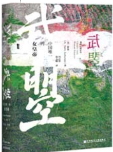
《武曌:中国唯一女皇帝》 [美]罗汉 著 社会科学文献出版社