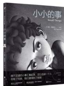
《小小的事》 [澳]梅尔·特里贡宁 著 北京联合出版公司