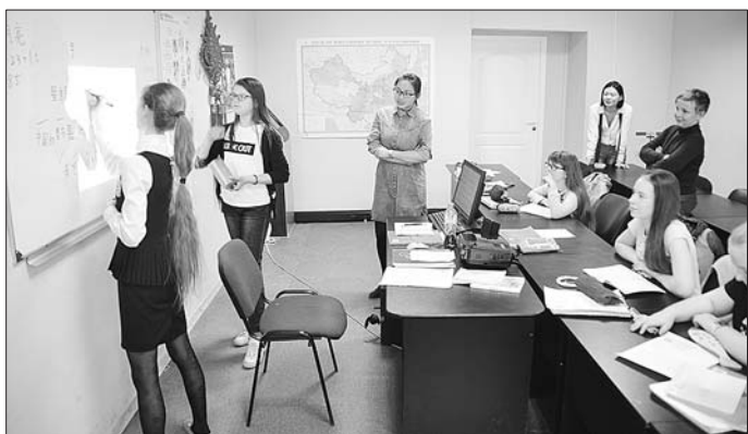
圣彼得堡的孔子课堂正在上课。

2020年,汉语将成为俄罗斯的“高考”课程;会汉语找工作工资会翻番。在中国强起来的背景下,俄罗斯出现了汉语热。三年来,圣彼得堡教授汉语的机构从几家暴涨到一百多家,而圣彼得堡独立孔子课堂做得最好。