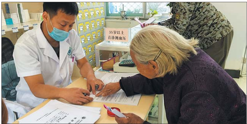
临床医生面对面与群众签订家庭医生服务协议。