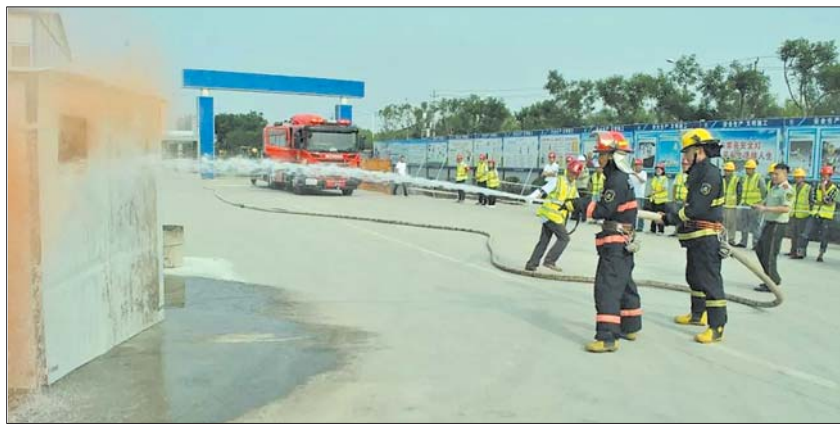
消防人员接警后立即到达现场进行灭火作业。

本报5月24日讯(记者 石剑芳 通讯员 方超) 天气越来越炎热,夏季是火灾的高发期,为提高施工人员的消防安全意识,提升掌握逃生处置能力和防范火灾发生。近日,中铁建工集团明水眼科医院项目部举行一场消防应急演练活动。