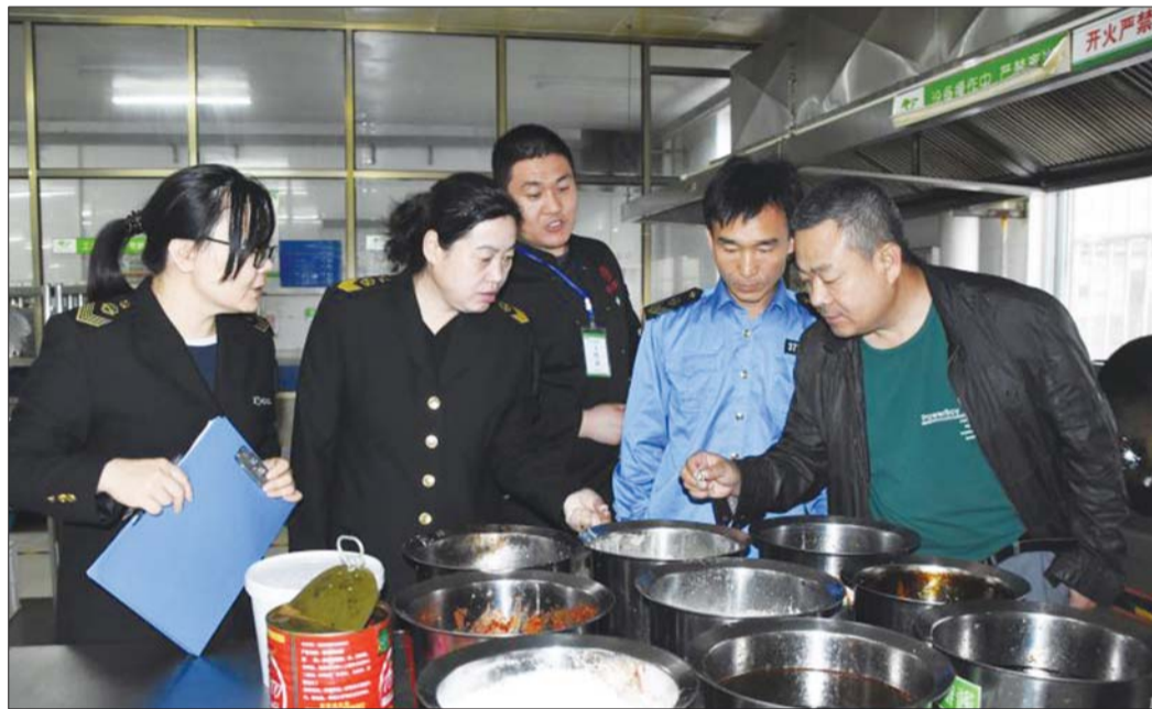
开展考前食品安全隐患排查,为广大考生“保驾护航”。

执法人员同时对各单位从业人员开展培训及管理、是否按规定开展食品安全自查、学校及食品经营者是否落实餐饮服务食品安全操作规范及落实原料索证索票、进货查验、食品贮存、食品添加剂管理、餐饮具清洗消毒、用水卫生、食品留样、从业人员健康管理等环节进行检查,并如实客观指出存在的问题,并督促整改。记者了解到,高考期间,执法人员将入驻考点学校食堂和高考指定宾馆,每餐前对所有食材进行快检,全天候监控餐饮供应情况,不断加大高考期间食品安全监督巡查力度,防控高考期间食品安全风险,保障高考期间的食品安全。