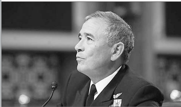
原美军太平洋司令部司令哈里斯

其实,压根不用日本操心,澳大利亚对“印太战略”的态度甚至比日本还激动和兴奋。相比日本,澳大利亚的地缘位置偏远,虽然也是美国铁杆盟友,但一直在美国亚太战略中地位偏弱,存在感不强。