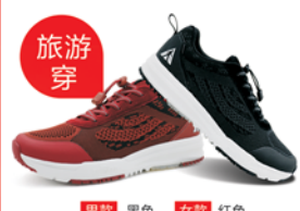
男款 黑色 女款 红色

立体新风透气系统 凉爽不捂脚 3D高分子缓震环 软弹不累脚 4向防滑科技 稳当不打滑