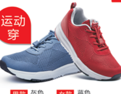
男款 灰色 蓝色 女款 蓝色 红色

吸湿凉感纤维 凉爽不捂脚 3D高分子缓震环 减震不累脚 耐磨防滑鞋底 抓地不怕滑