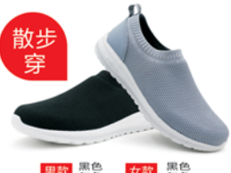
男款 黑色 灰色 女款 黑色 灰色