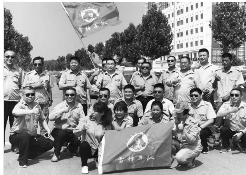
雷锋车队成员们再次系上“绿丝带”。

本报济宁6月6日讯(记者 孔令茹) 6日，济宁市出租与公交行业协会雷锋车队的40余辆出租车系上了绿丝带，他们将在高考期间暂停营运，免费接送咱们济宁的高考学子。而爱心送考这事，车队成员已经坚持了十几年。