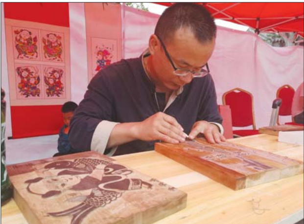
手艺人现场展示精湛技艺。

第二进院落内,聊城“文化和自然遗产日”展示展演暨聊城市首届文创节开幕,传统汉服秀、百余名朗诵爱好者身着汉服集体吟诵诗经《小雅·鹿鸣》,身着太极服饰的老人在广场上表演太极,来自阳谷的表演队伍带来了雄浑嘹亮的黄河夯号表演。身着旗袍的女士们佩戴上红色的剪纸饰品完美融合了传统旗袍文化和剪纸艺术,展示了别样的美。主持人还将现场的文