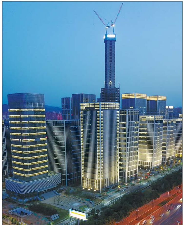
汉峪金谷夜景照明点亮了经十路。