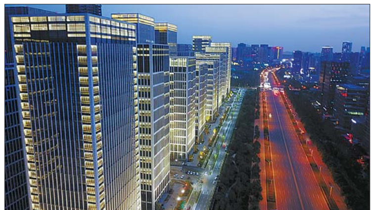
汉峪金谷夜景照明与经十路融为一体。