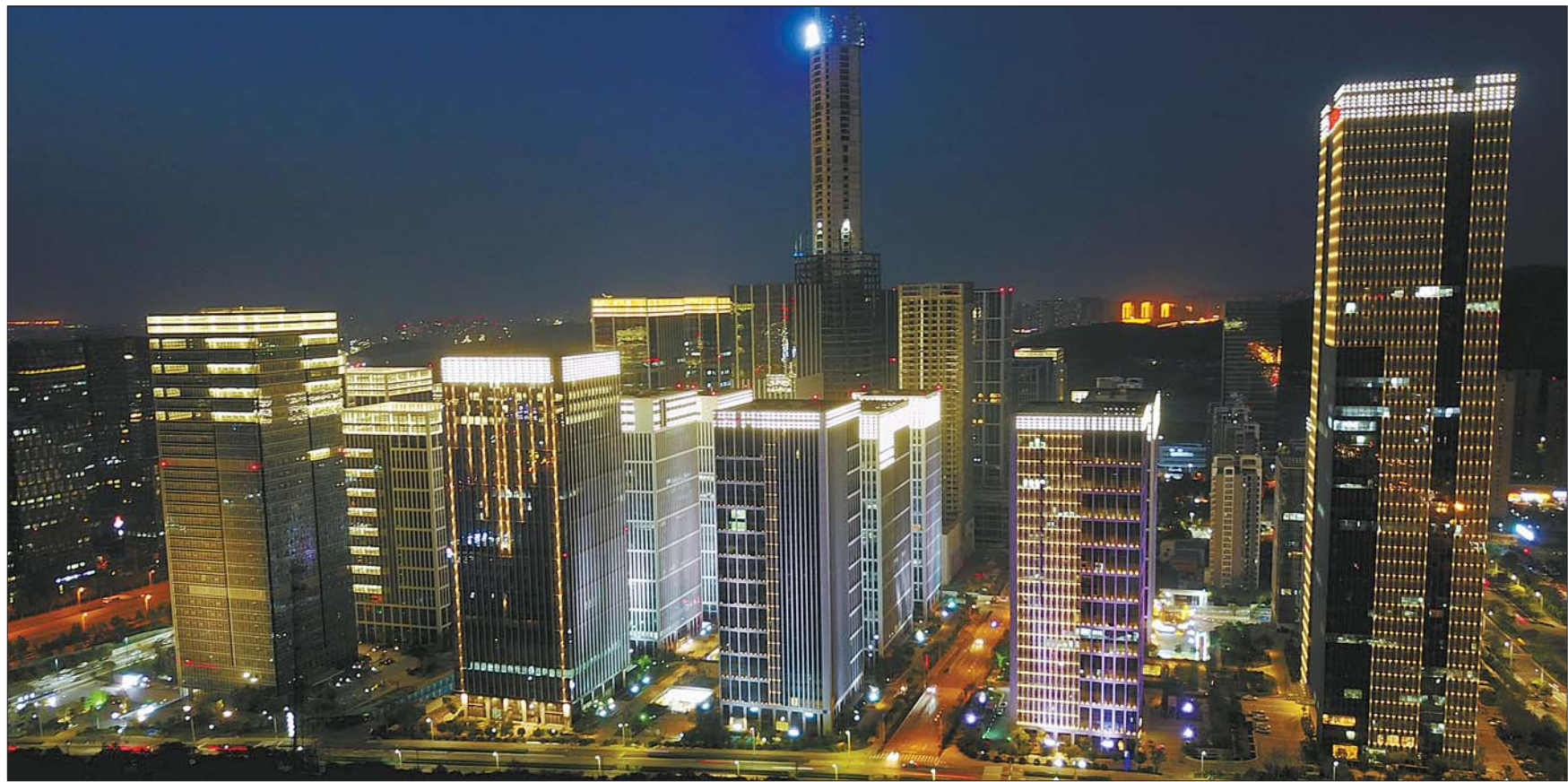
避免光污染,汉峪金谷夜间照明绚丽却不影响视野。