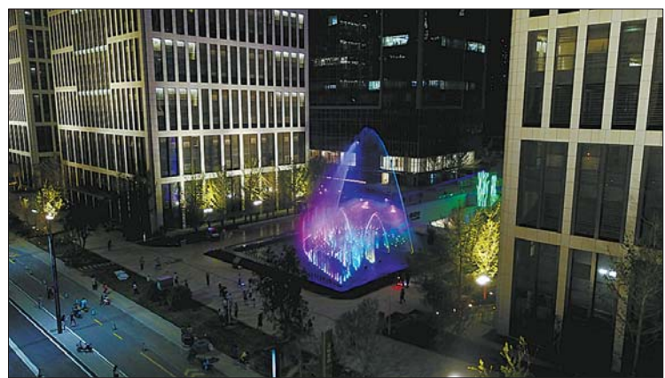
“金谷水秀”灯光绚丽,引人入胜。

据悉,汉峪金谷目前对A1-A7地块共计38栋建筑进行了夜景照明的建设。项目建筑面积约192万平方米,共使用5.5万套LED灯具。在确保实现夜景照明设计效果的同时,项目建设在设计中也考虑了全过程节能为重要的设计目标,灯具产品全部选用了LED高效节能灯具,最小灯具仅十余瓦,最大灯具不过三四百瓦,同时配以高效能的智能控制系统,既实现了“按需开灯”的理念,同时也实现了从设计、实施、运行全过程的节能。