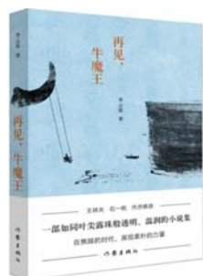
《再见，牛魔王》 李云雷 著 作家出版社