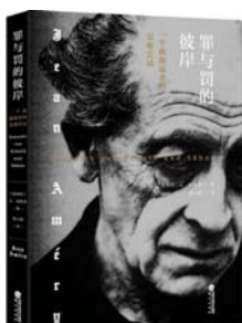
《罪与罚的彼岸》 [奥地利]让·埃默里 著 鹭江出版社

本书围绕着年羹尧与雍正君臣关系的演变历程，全面回顾了年羹尧一生从得意到失意的宦海浮沉，从新颖的角度，立体而真实地展现了年羹尧性格的复杂多面。此外，对年羹尧九十二条罪状中的虚实实实，作者细致地予以客观分析，并对其死因提出了一些新见解。