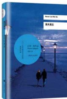
《莫失莫忘》 石黑一雄 著 上海译文出版社

美国前总统比尔·克林顿与悬疑畅销小说家詹姆斯·帕特森跨界合作，共同撰写了一部政治悬疑小说《失踪的总统》，讲述了由一起总统失联案引出的国际恐怖组织暗袭美国的惊天阴谋，涉及多起美国历史政治事件，克林顿试图通过本书展现总统这一身份需要面临的艰难抉择以及美国政治全貌。