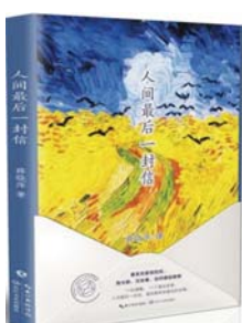
《人间最后一封信》 薛晓萍 著 长江文艺出版社

1912年10月，埃默里生于维也纳的犹太家庭，纳粹上台后，他不断流亡，于1943年被捕，在比利时布伦东克战俘营饱受一年酷刑后，被押至奥斯维辛，直至1945年被解救。让·埃默里在这本短文集以坦白和沉思的方式，对奥斯维辛受害者的生存处境做了一次探究。