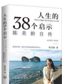
《人生的38个启示》 陈美龄 著 上海三联书店

作者十几年来在多家养老机构做义工，与老人们结下深厚友谊。本书以十一位老人的遗嘱为主线，记录了十一个真实难忘的故事，有的令人扼腕唏嘘，有的令人无限怅惘，有的让人深思。老人的孤独晚景和心境，不仅仅是心理感受，更是一种认识自身和观看世界的方法。