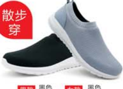
男款 黑色 灰色 女款 黑色 灰色