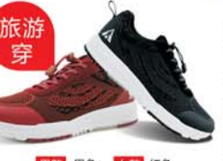
男款 黑色 女款 红色

立体新风透气系统 凉爽不捂脚 3D高分子缓震环 软弹不累脚 4向防滑科技 稳当不打滑