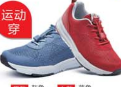
男款 灰色 蓝色 女款 蓝色 红色

吸湿凉感纤维 凉爽不捂脚 3D高分子缓震环 减震不累脚 耐磨防滑鞋底 抓地不怕滑