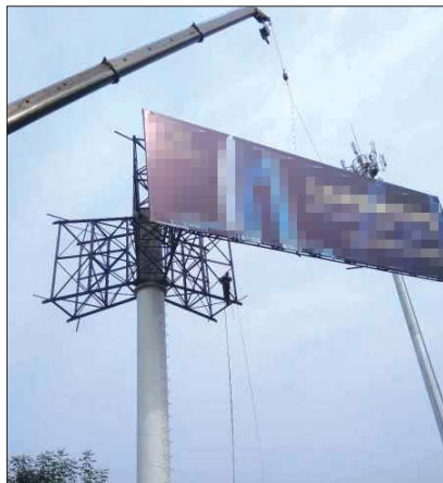
拆除现场。

据了解,21日拆除的此处广告为三面广告,面积为324平方米,大约用了4个半小时拆除完毕。目前,市城市管理局岱岳区分局粥店执法所已依法拆除4处违法户外广告牌,其中一处为两面立柱式广告,三处为三面大立柱广告。