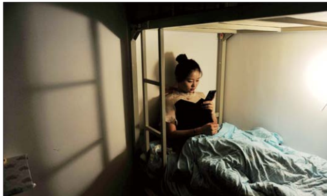
从学校宿舍搬进了培训机构给准备的小宿舍里，却再也找不到原来学校宿舍里的那种氛围。