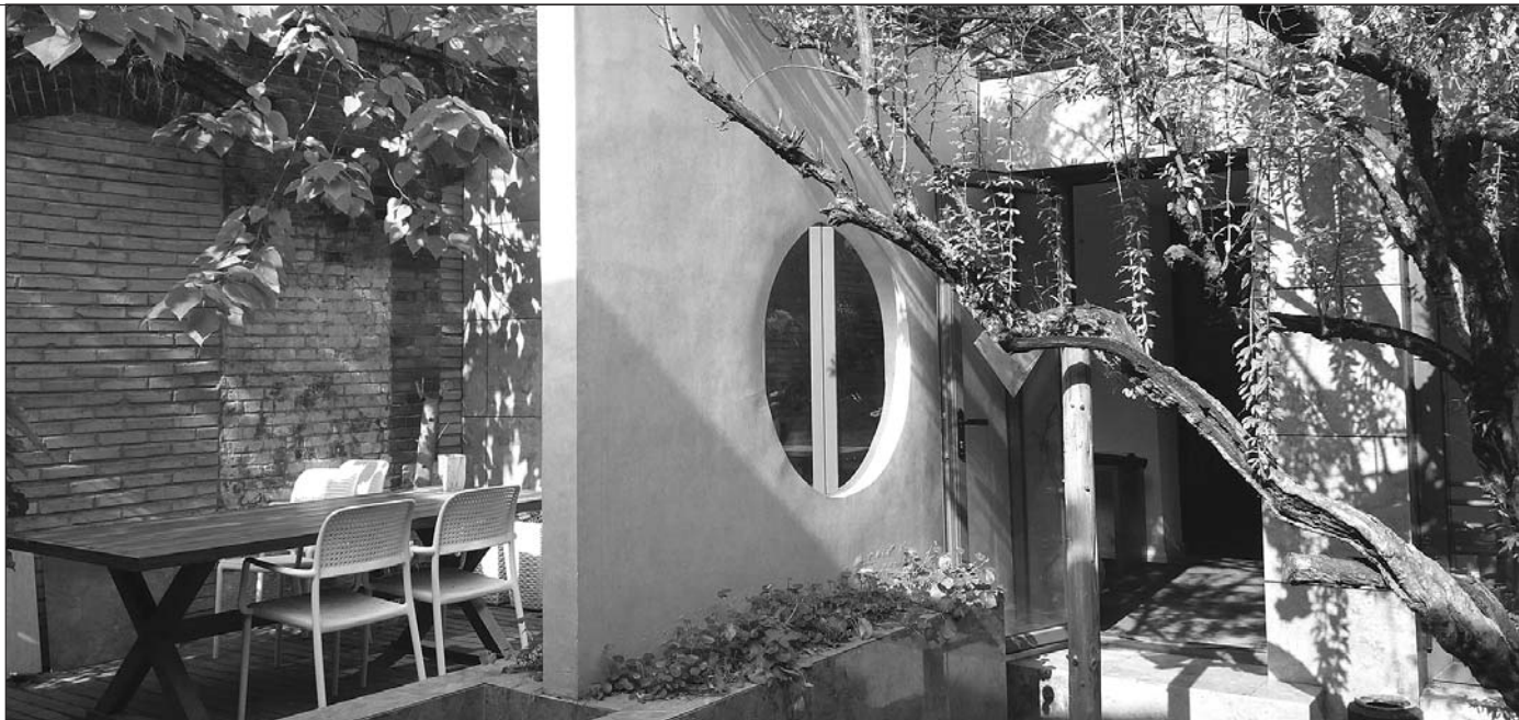
这就是列入济南首批历史建筑的后宰门街41号院。