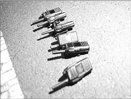
◀ 3日晚,交警现场查扣大量渣土车司机用于通风报信的对讲机。