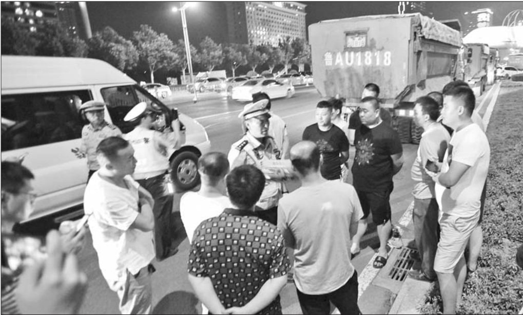
在3日晚的查处现场,交警给渣土车司机讲述应遵守的法律、法规。

晚上9点,大批渣土车涌出工地大门。民警判断可能超出路线范围行驶的渣土车,有针对性地设点查处。短短十分钟的时间,就有10辆不按通行线路通行