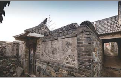
栲栳村里的老宅很多是清末富商所建

船帮的商船人员配备齐全,除了老大(船长)、帮舵(副船长)、三角(船员领班,并负责设施保障)、缆头(船头负责操锚),还有管账、艄公、香童等。“金长生”号船上多达34人,中等船接近30人,小船20人上下。船上各岗位分工明确,老大主要掌管航行及船上的重大事务,遇大雾风浪等恶劣天气时,最能考验老大的水准。管账的负责业务往来,有时会先到预定地点联系购销货物等事宜,多时不在船上。从金口到上海港,若顺风顺流日夜兼程需三四天的时间,到丹东需5天的时间。若遇风浪天气或大风暴雨,有时需半月或月余才能抵