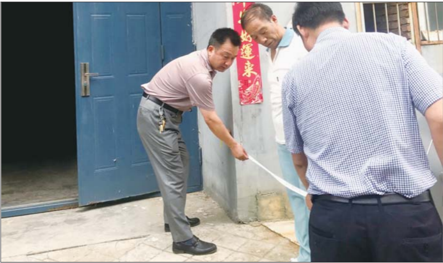
下午1点,赶到地矿局宿舍丈量电梯井位置。