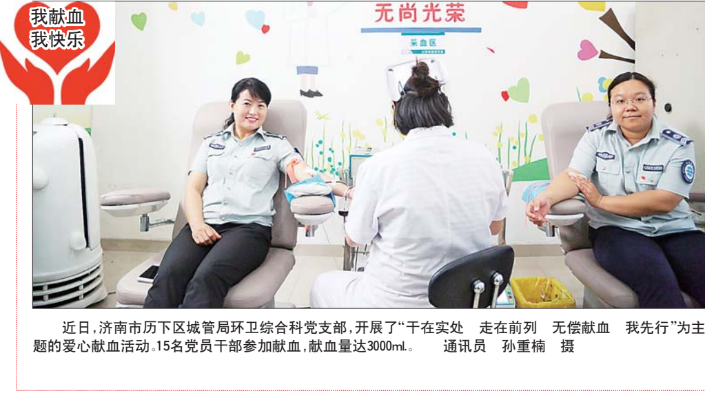
近日，济南市历下区城管局环卫综合科党支部，开展了“干在实处 走在前列 无偿献血 我先行”为主题

走振兴中医之路，让中医药走向世界，是千千万万中医人的梦想。不忘初心，砥砺前行，吕剑已然用自己的努力走在路上。