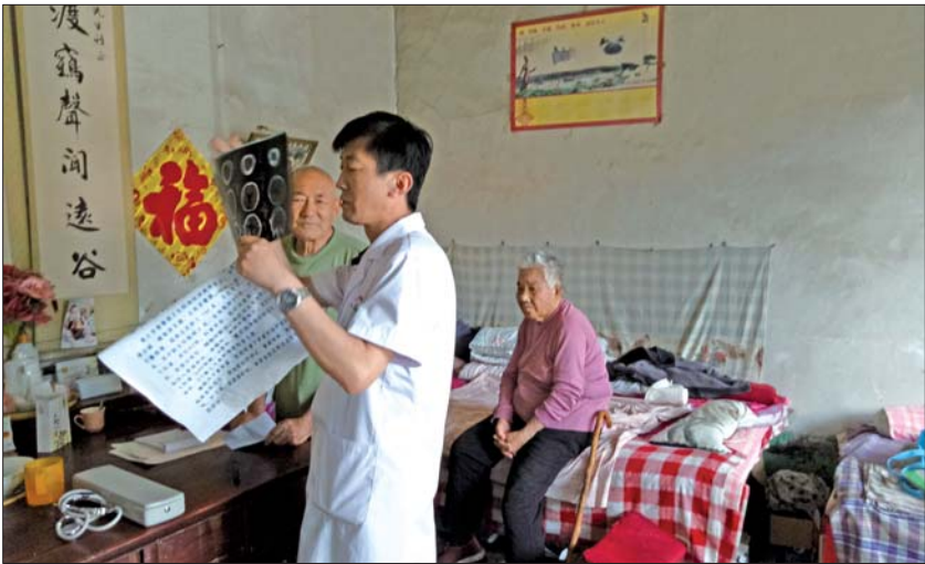
下村服务医师通过CT片判断患者病情。

“您好,我是普集街道一名村民,我想借助贵平台向普集医院的医生们表示感谢,去年以来他们一直上门免费给我做康复治疗,帮助我重拾向往新生活的信心。”近日,记者从普集社区卫生服务中心获悉,因长期下村为失能人员服务,再获患者认可,并通过政府热线12345为该中心发来这封感谢信。