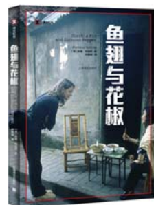
《鱼翅与花椒》 [英] 扶霞·邓洛普 著 上海译文出版社

本书以美国文化为透视点，指出美国人越来越不愿意将理性视为一种美德，不愿意对他们在社交媒体上看到和听到的东西施以严格的事实和逻辑标准，这种情形若任其发展，人们将知道得越来越少，未来只能成为充斥着垃圾思想、伪科学、假新闻、后真相的精神荒原。