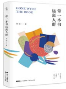
《带一本书远离人群》 思郁 著 广东人民出版社

本书收录了余华从1986年至今创作的中篇小说，包括《我胆小如鼠》《夏季台风》《四月三日事件》《现实一种》《河边的错误》《一九八六年》等13篇。书中有作者对命运的叩问、对人性的探究和对自然的敬畏，让我们看到了他对生命的无限怜悯和对现实的深沉思考。