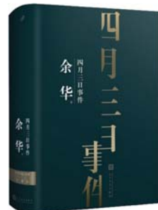
《四月三日事件》 余华 著 人民文学出版社

1994年英国女孩扶霞在四川大学交流学习一年，其间与热情泼辣的四川人因一道菜品，一张张食谱而相识相知。在这本英国女孩与中国菜相逢的“历险”手记中，通过扶霞的视角，我们得以用全新的角度来了解我们熟悉的川菜。原来不同地方的食物，都有其独特的气质。