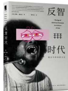
《反智时代：谎言中的美国文化》 [美] 芬珊·雅各比 著 新星出版社

作者从宋画入手，结合文献记载和前人研究成果，揭示了宋朝“风雅”生活的若干侧面，将宋人起居饮食、焚香点茶、赶集贸易、赏春游园、上朝议事的生活图景活灵活现地展现在读者面前，展现了宋朝特有的社会风貌和时代精神。