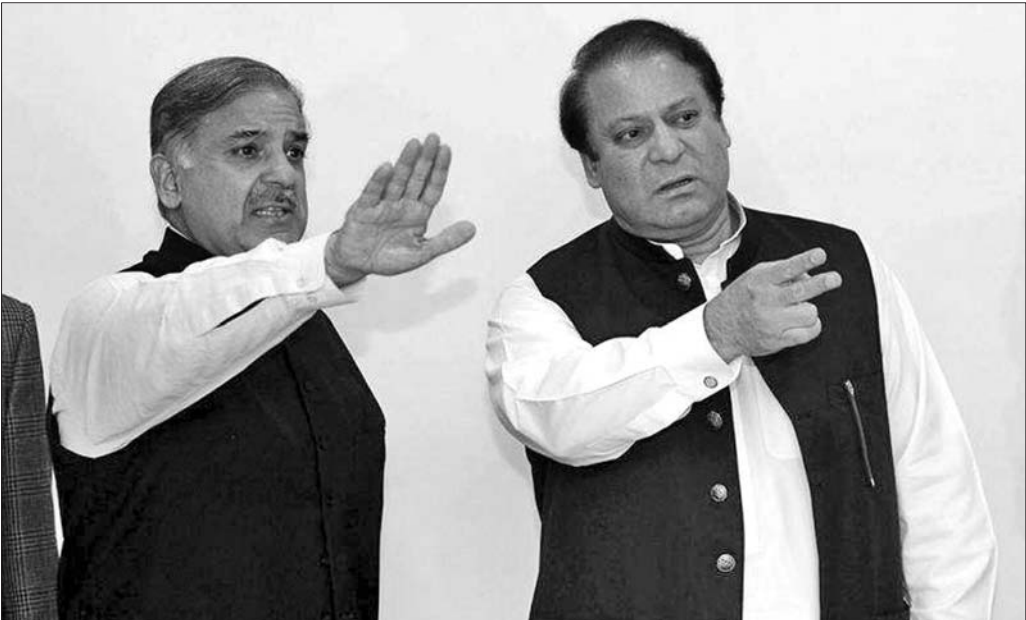
巴基斯坦穆斯林联盟(谢里夫派)领导人夏巴兹·谢里夫(左)和哥哥、前总理纳瓦兹·谢里夫

25日,巴基斯坦将迎来国民议会选举。目前,三个最有竞争力的政党:反对党巴基斯坦正义运动党、执政党穆斯林联盟(谢里夫派)和人民党在进行最后冲刺。届时,哪个政党会脱颖而出成为执政党?谁又会成为巴基斯坦新总理?