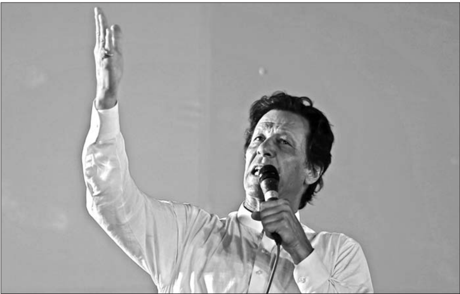
►巴基斯坦正义运动党领导人伊姆兰·汗