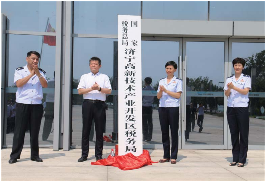
揭牌仪式现场。

本报济宁7月22日讯(记者 孔茜 通讯员 孔令师) 20日,国家税务总局济宁高新技术产业开发区税务局(以下简称济宁高新区税务局)挂牌,标志着原济宁高新区国家税务局、济宁市地方税务局高新区分局正式合并。合并后,济宁高新区税务局将承担区域内各项税收、非税征收征管等职责,促使执法和服务标准、业务流程等方面的大统一。