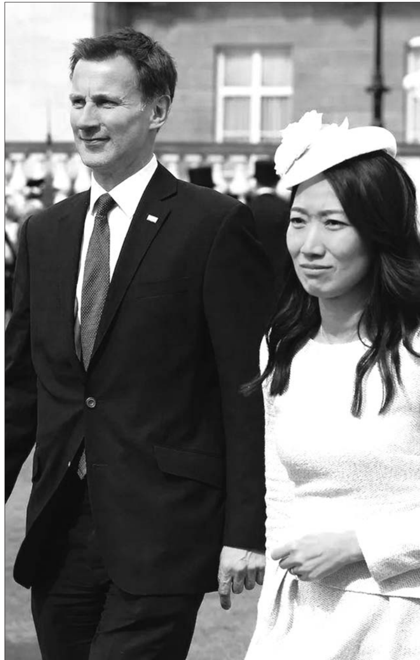
英国新任外交大臣杰里米·亨特和他的华裔妻子。