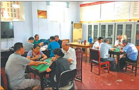
老党员活动室每天下午定时开放。