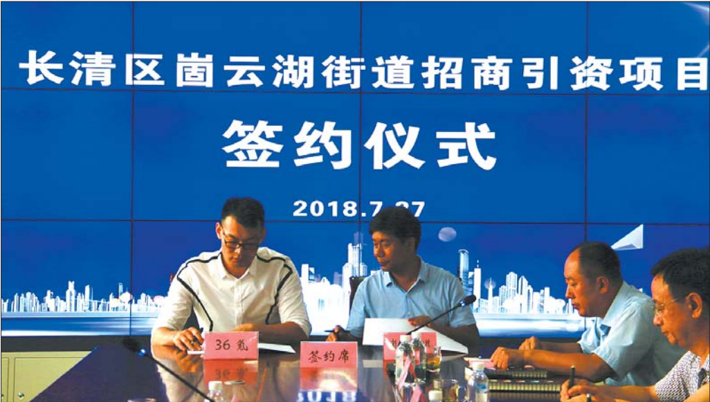
签约仪式现场。

本报讯 7月27日,崮云湖街道举行招商引资项目签约仪式,36氪集团、美视云科技正式签约落户梦翔小镇。 36氪是全国领先的市场化综合双创服务平台,目前已成长为一家科技创新创业综合服务集团,拥有新商业媒体-36氪传媒、联合办公空间-氪空间、一级市场金融数据提供商-鲸准,重点围绕媒体、投融资服务(FA)、联合办公、私募股