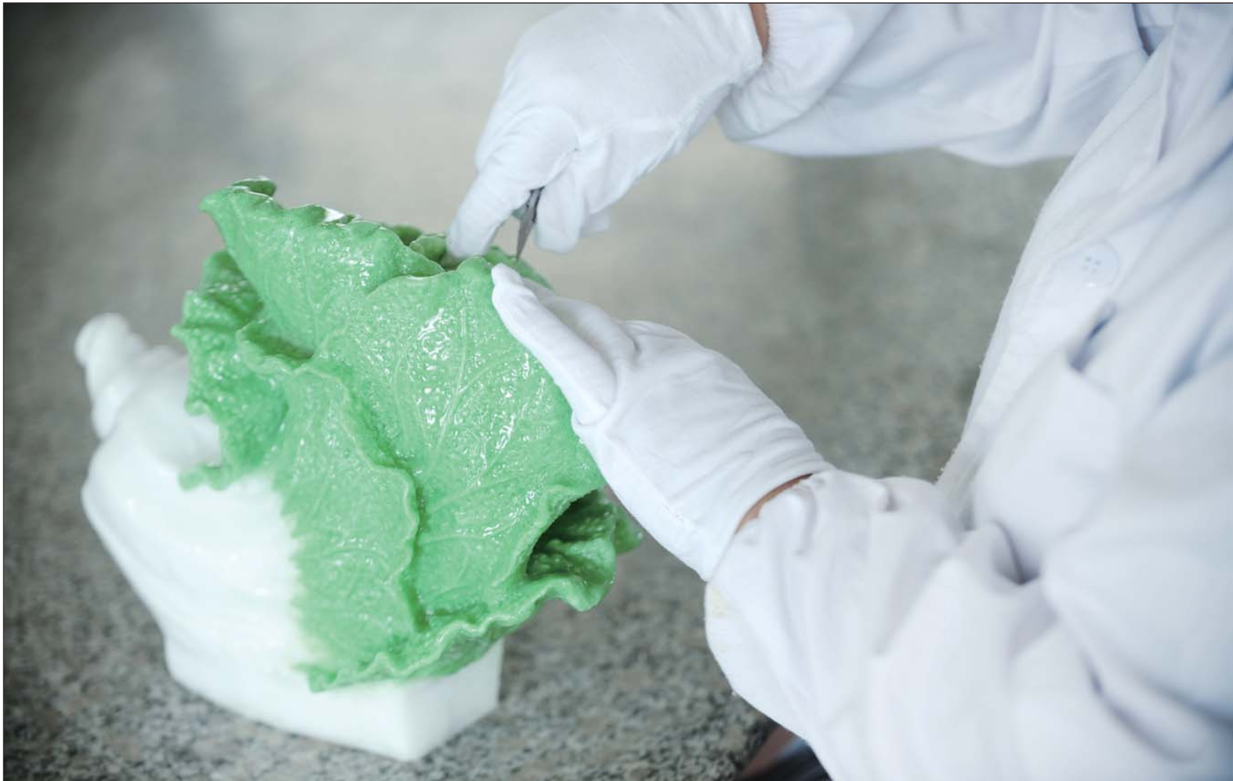
用盐雕刻而成的白菜。一件件作品在雕刻工人手中栩栩如生。