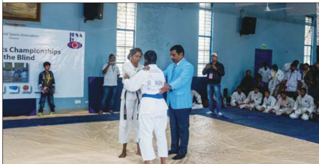
教练正在指导盲人女性学柔道。