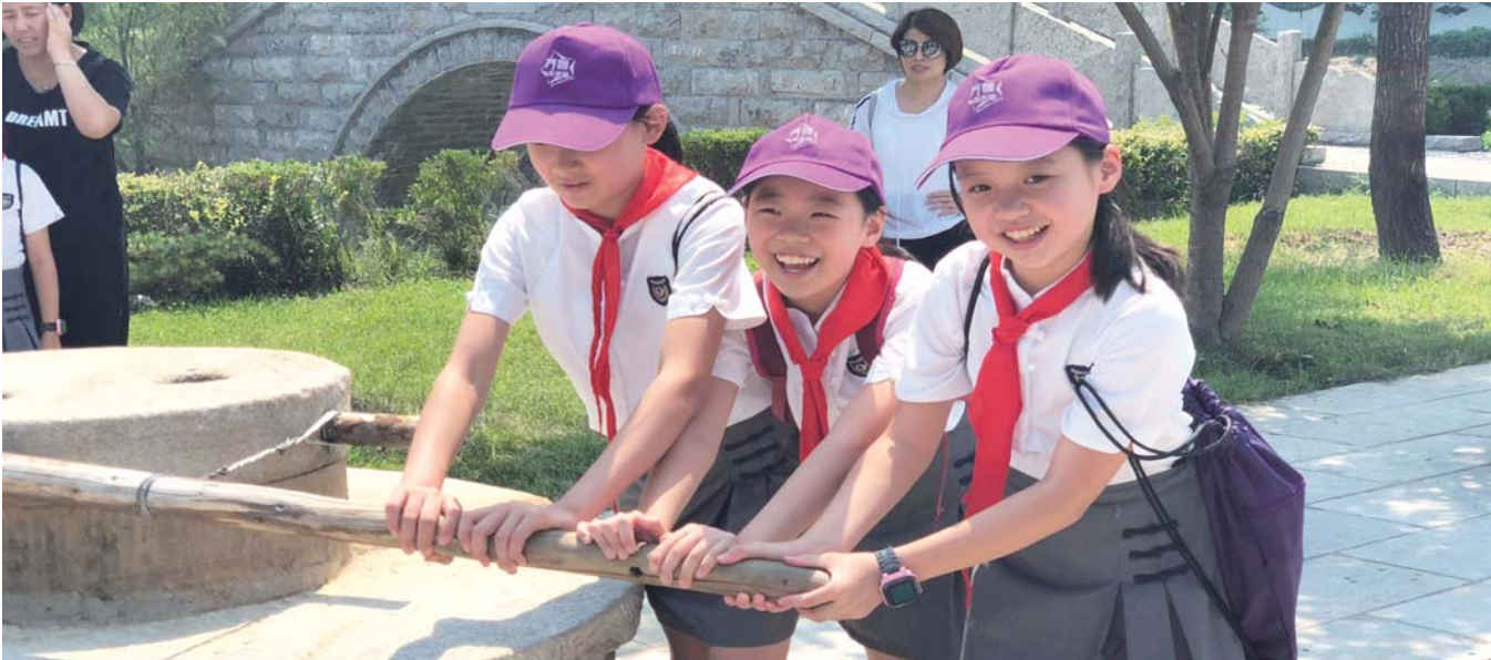
济南市纬二路小学学生在东阿阿胶城体验阿胶制作工艺。