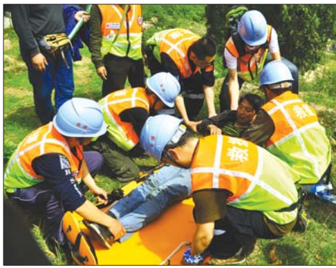
泰山救援队山地救援现场。

100名，帮助和救助省内外徒步登山爱好者300余人，曾经参加雅安地震等重大自然灾害救助。队伍获评“全省优秀志愿服务组织”等荣誉称号。