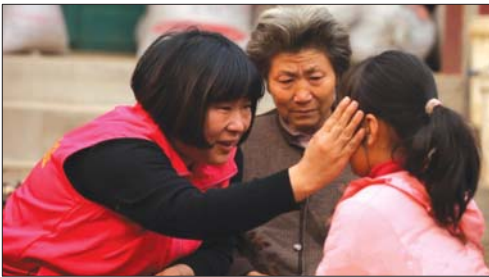
小荷公益负责人和西梅看望留守儿童。

近年来，泰安市在志愿服务方面涌现出了一大批先进典型。为大力弘扬志愿服务精神，助力创建全国文明城市，特以此刊集中展示，用他们的实际行动，感召更多的市民自觉践行志愿服务精神，加入志愿者队伍，主动参与文明城市创建，为创建全国文明城市贡献自己的力量。