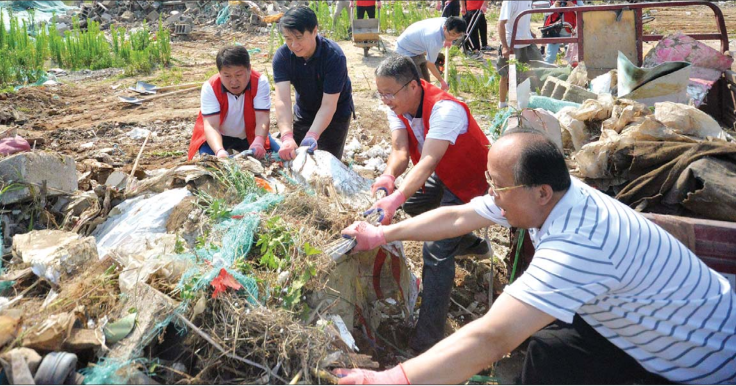
领导参与创城义务劳动。

五是计分方法严。文明城市对每项测评标准采用1或0的计分制(要是满分，要是零分)，最后综合计算形成测评成绩。