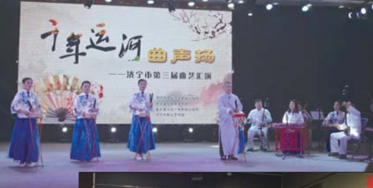
全市曲艺精品在第三届曲艺汇演上集中亮相。