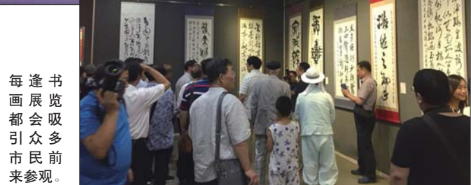
每逢书画展览都会吸引众多市民前来参观。