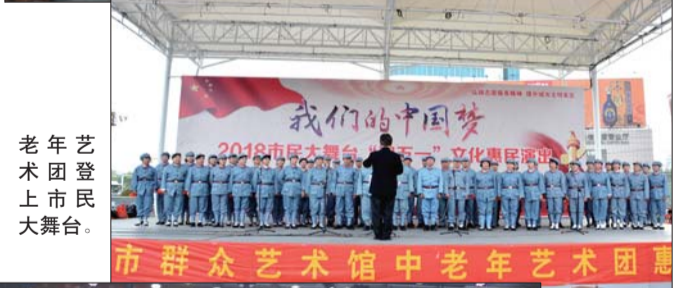
老年艺术团登上市民大舞台。