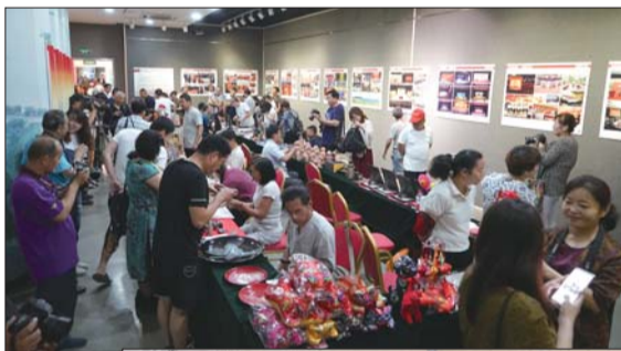
精彩纷呈的“遗产日”非遗展览体验活动。

此外,作为群众艺术馆众多文化项目中同样颇具影响力的部分,每年丰富多样的惠民展览活动也吸引了大批文化爱好者,每逢周末便聚拢向城市中心。据相关工作人员介绍,仅今年上半年便举办展览22场,累计展览天数达110余天,观看展览人数万人次。包括“喜庆十九大 巡礼文化山东”山东省首届艺术摄影展、交流的目光——山东省与巴伐利亚州缔结友好关系30周年摄影交流展、“相约孔孟之乡”2018中韩书法交流展、太湖情怀——无锡中青年书法篆刻作品提名展等主题性书画展览。通过举办展览活动,有效提升了市民艺术欣赏水平。