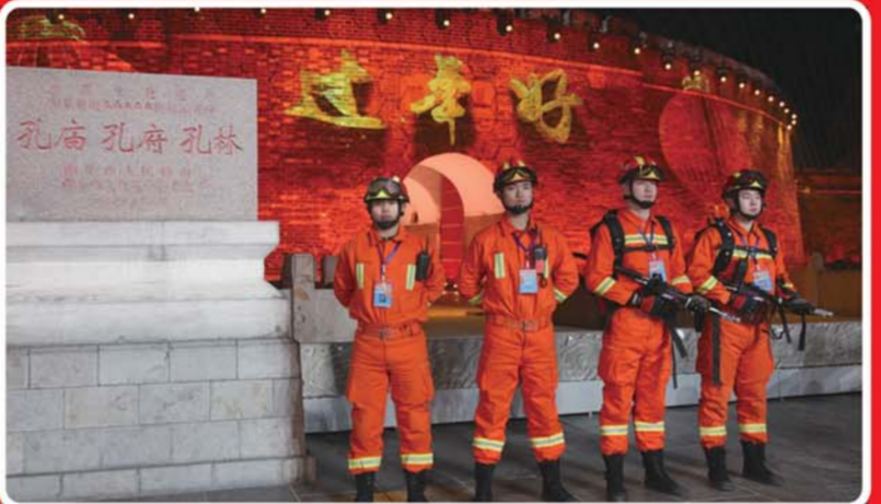
执行重大活动消防安保任务。