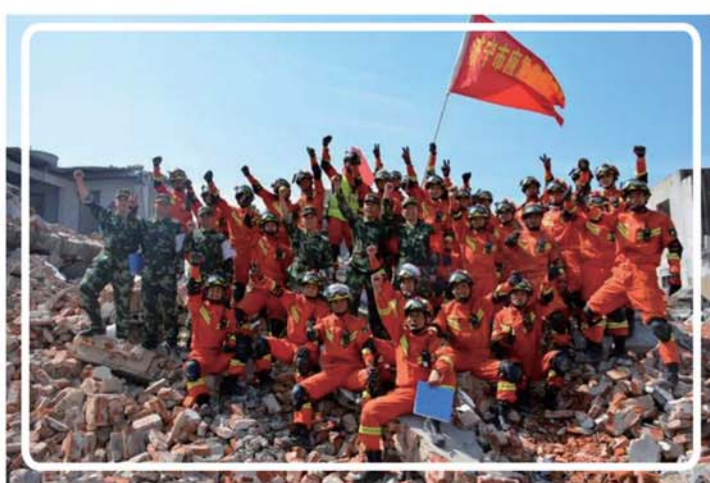
攻坚行动—2018地震救援实战拉练。