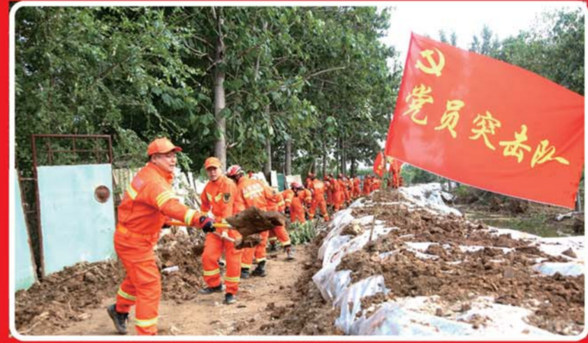
增援潍坊寿光抗洪救灾。