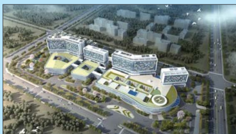
建设中的济宁市立医院(济医附院太白湖院区)效果图。

2015年,济医附院通过JCI国际医院标准认证,被山东省卫计委确定为“山东省区域医疗中心”,2017年医院被国家卫计委评为“全国优质医疗服务示范医院”、“全国改善医疗服务行动先进单位”,2018年6月顺利通过国家三级甲等医院复审;自2003年至2017年底,实施临床路径管理患者数量达到45万例,今年7月当选山东省医院协会临床路径专业委员会主任委员单位;医院区域医疗中心技术人才优势日益显现,发起成立了济医附院胸痛专科联盟、鲁西南康复专科学联盟、济宁市质量管理联盟、济宁市眼科联盟等;2017年香港艾力彼医院管理研究中心发布榜单,济医附院位列“中国医院竞争力地市级医院100强”第16位。