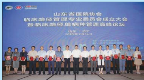
该院临床路径管理工作继续走在全国前列。

人才激励措施的落地,激发了各类人才创新工作的热情,也促进了医院学科建设与发展,提升了医疗质量与服务水平,医院综合实力不断增强。5年来,该院开展各类新技术330余项;加快专科建设,先后建立了生长发育、乳腺癌、帕金森、淋巴瘤、癫痫、垂体瘤、不明原因发热、糖尿病足等8个病种特色专科,其中矮小症专科2017年被评为山东省临床精品特色专科。此外,中