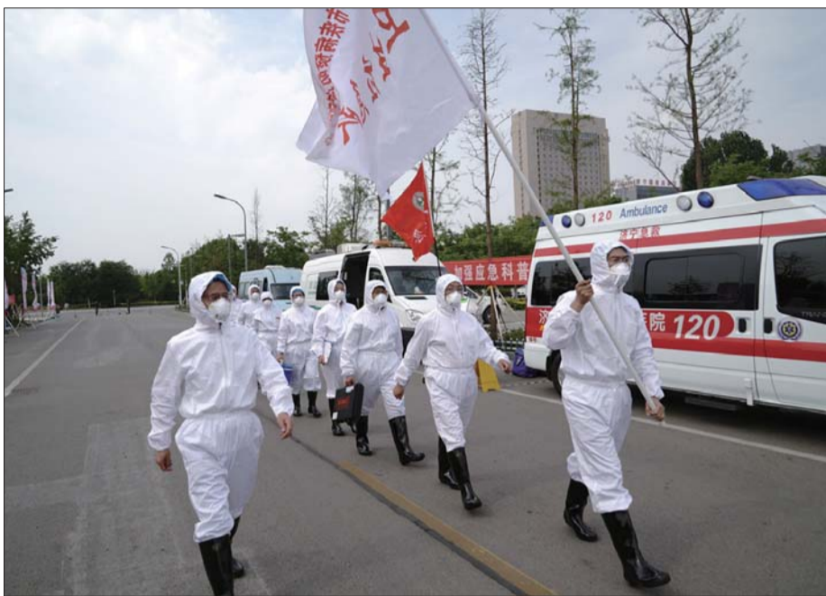
开展防疫知识宣传和应急装备展演。

按照市“放管服”改革工作指挥部办公室要求,艾滋病免费自愿咨询检测确定为济宁市疾控中心“一次办好”事项。“我们进一步优化了工作流程,当群众前来咨询时,工作人员会耐心解答群众关切,如确实需要进行检测,会与其