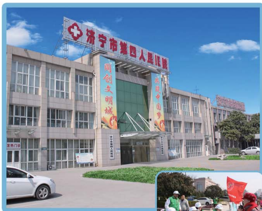
▲门诊楼 ▶组织医疗专家开展志愿宣传咨询服务

理,培育专科特色治疗。伴随着砥砺前行的铿锵步伐,医院制定了一套行之有效的中长期发展规划,使得医院发展步入快车道,迅速成长为鲁西南地区医疗行业的璀璨明星。