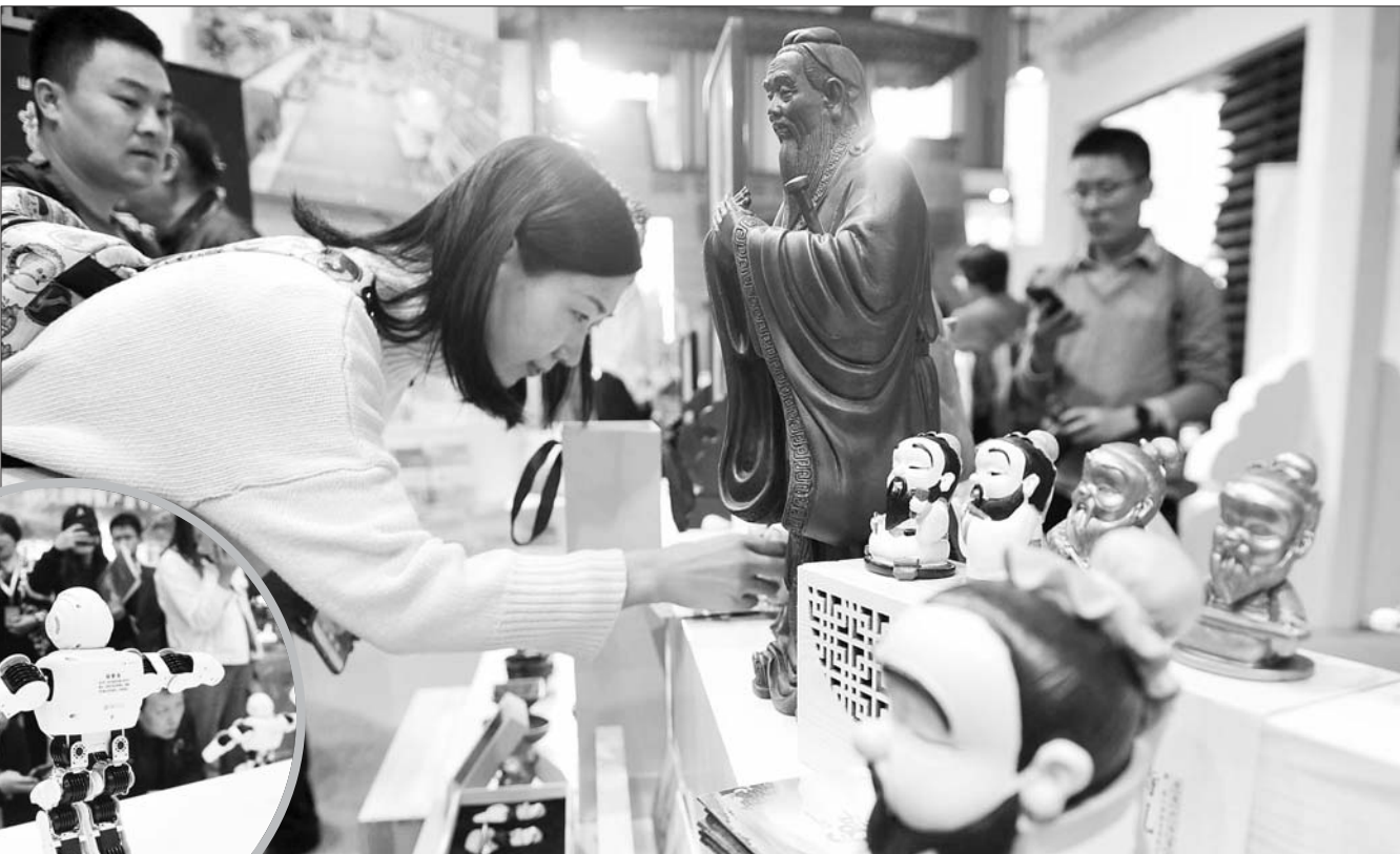
▲11日,第七届山东文博会上,诗礼夫子文创产品引得不少观众注目。

山东文博会自2006年开始,每两年举办一届,迄今已成功举办6届,形成了集产品展示交易、项目推介洽谈、行业发展研讨等多种功能于一体的展会框架,逐步发展成为集聚文化产业资源、洞悉文化产业动向、开展文化产业合作的重要平台,成为在全国有重要影响力的区域性文化展会。