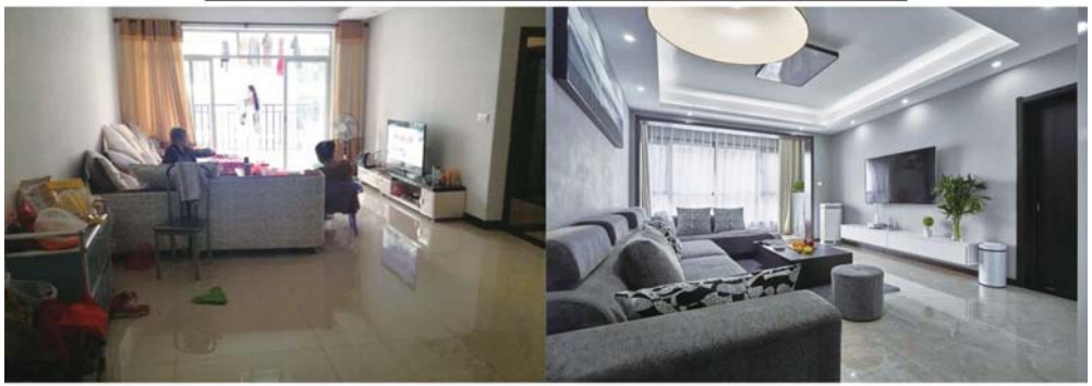
# 乡村风秒变现代风，生活质感飙升