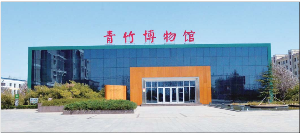
青竹画材科技有限公司博物馆