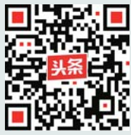
今日头条订阅号“齐鲁鉴赏”