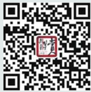
齐鲁鉴赏微信公众平台

扫码关注“第十届中国书画名家精品博览会”精彩内容。齐鲁壹点订阅号“齐鲁鉴赏”同步推送。