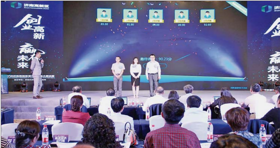
高新区第三届创业大赛决赛现场。

本报10月11日讯(记者 修从涛 通讯员 杨晓) 9月29日,由济南高新区社会事务局主办的2018济南高新区第三届创业大赛决赛及颁奖典礼落下帷幕。12个参加决赛的小组经过激烈角逐和评委的综合评审,初创企业组一等奖由济南国科凯芯电子科技有限公司获得,创业团队组一等奖由有声可触摸绘本“川川”系列的研发团队获得。 据了解,大赛自8月启动以来,受到了社会各界的广泛关注和创业青年的积极参与,共收到参赛项目及团队近百个,参赛项目涉及人工智能、生物医药、健康服务、智能制造、节能环保、文化创意、互联网、旅游休闲等众多领域。本次大赛不乏新亮点,首次开设了团队赛,为高校在校生活和毕业生提供直通赛道,通过项目答辩等方式,考验选手的项目组织能力和团队组织能力,甄选优异的创客团队。 大赛主办方表示,赛制的创新,更多的是想实现济南高新区对于优异项目和优秀人才团队选拔的目的,力争使更多创业者通过本次大赛加入“创业高新,赢在未来”的创新