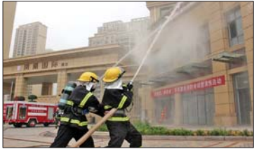
水枪压制蔓延火势。

本报10月11日讯(记者 修从涛) “凤凰国际南区底商二层因发生火情,着火部位浓烟滚滚,并有火势蔓延之势,数十名业主被困,情况十分危急……”近日,凤凰国际南区传来“火情”,一场由东拓置业联合济高控股集团安全环保部、绿城物业主办的消防演习正式开始。 “火情就是命令!”火情发出第一时间,小区物业消控室值班人员立即安排巡逻人员对火情进行侦查确认,“我已到达13号楼二单元二楼,现场确认发生火灾,过火面积大约20平米,着火物质为木质家具,楼内有大量烟雾,室内有被困人员,请求立即处置。”