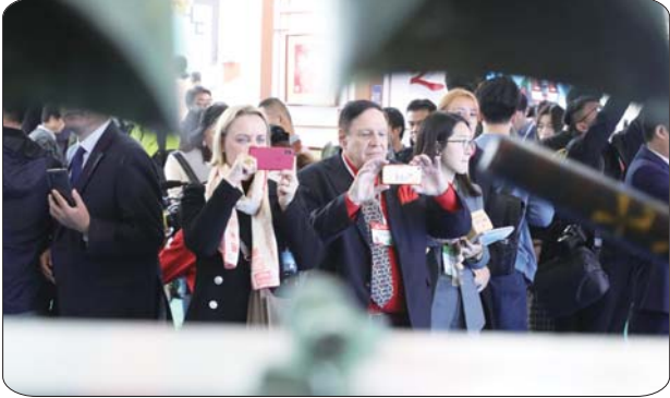
国际友人记录邹鲁礼乐演出。