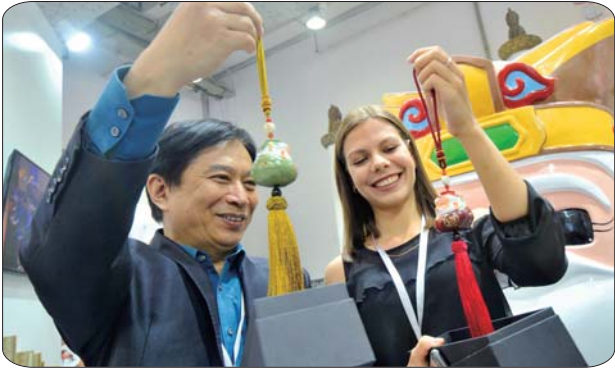
一位来自俄罗斯的留学生对孔子文创产品非常感兴趣。