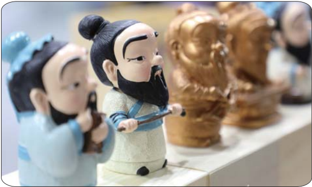
展厅内展出的诗礼夫子文创产品。