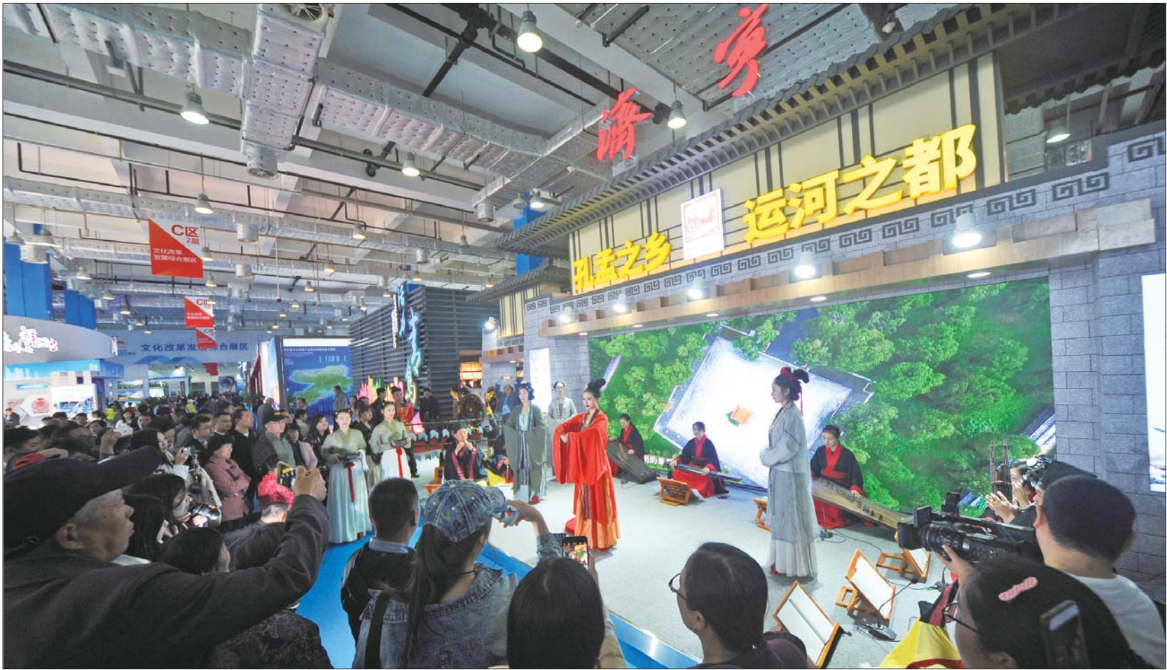
11日，省文博会济宁展厅宾客迎门。