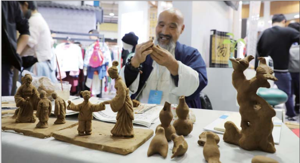
传统手艺人现场展示泥塑作品。

中秋节期间，卖出了上万套。展区另一侧，同样主打“萌”系的诗礼夫子也再次高调亮相。走进济宁展区的几位文广新系统的负责人点评说，诗礼夫子具有“网红气质”，应该努力打造成为俄罗斯套娃那样的国家礼品。