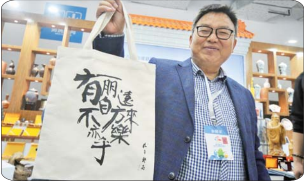
现场展出的创意手提袋。