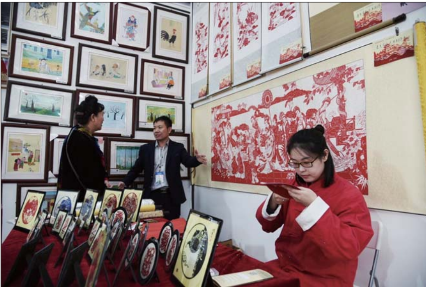
德州展区展示的剪纸作品。

文明、科技发展、生态旅游展示出来。现场嘉宾可以通过VR眼镜,较好的体验德州文化风情和发展风采。