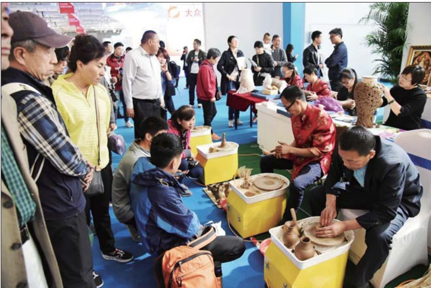
参展嘉宾观看黑陶工艺大师制作黑陶过程。