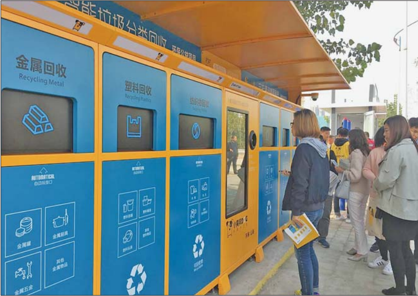
智能垃圾分类回收箱能吞入垃圾“吐”出钱。

本报10月12日讯(记者 张晓燕)12日,山东省暨济南市第二十四届环卫工人节庆祝大会在济南市章丘区召开。在章丘区一处餐厨废弃物处理中心,10亿只美洲大蠊(俗称“蟑螂”)每天可吃掉餐厨垃圾50吨,开创了生活垃圾处理新模式。另外,智能垃圾分类回收机也能吃掉垃圾“吐”出钱。庆祝大会前,参会人员一同观摩了章丘区餐厨垃圾处置、三涧溪村垃圾分类项目。在章丘区餐厨废弃物处理中心,美洲大蠊养殖车间吸引了很多人的目光。据了解,工作人员用制浆机把餐厨垃圾粉碎后打成浆状,沿着输送管道运输到美洲大蠊饲养室,最终垃圾被全部吃掉,整个过程实现自动化操作,无需人工喂食。这里设计最大日处理餐厨垃圾能力有200吨。车间工作人员介绍,一个车间的美洲大蠊存栏10亿只,每天可处理餐厨垃圾50吨,目前第2个养殖车间已基本建成,计划10月底投用,后续2个养殖车间计划明年建成。“我们算了下,一只美洲大蠊一生可以吃它身体体重15倍的餐厨垃圾。”“没想到现在垃圾分类都这么高级,投入垃圾还可以获得现金。”在三涧溪村一处垃圾分类站处,智能垃圾分类回收机吸引了不少参观者。记者注意到,这个智能垃圾分类回收机可回收金属、塑料、纺织品、纸类、玻璃和有害垃圾等。“只要将废品按照类别提