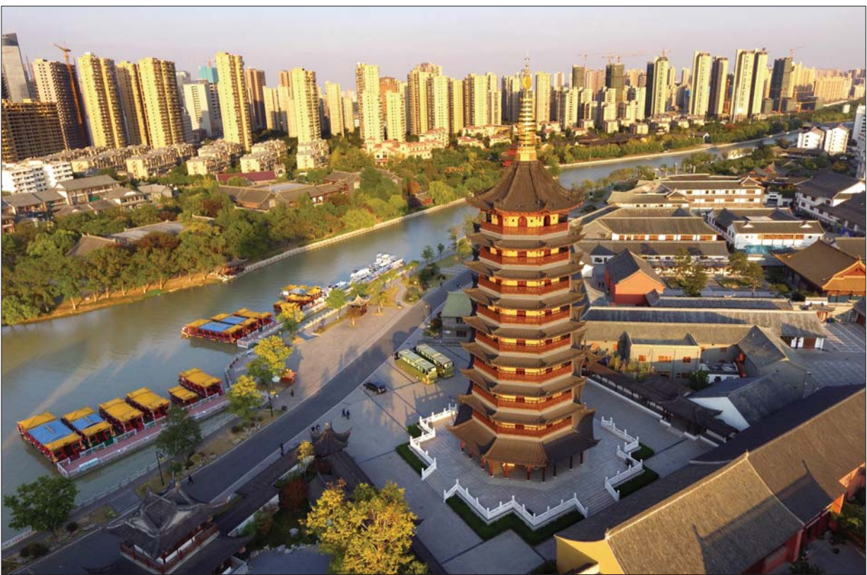
里运河文化长廊。

“一条大运河，半部中国史”。金秋十月，淮安城桂香弥漫，大运河两岸漕运总督府、水上立交、河下古镇、里运河文化长廊、白马湖、洪泽湖大堤……如颗颗珍珠，串成项链，穿越千年，焕发新姿，已然成为这座运河古城的闪亮名片与鲜明标识。10月11日至14日，来自全国30多家媒体的70余位总编和记者齐聚淮安，参加“运河明珠淮安行”大型融媒体采访活动，共同领略生态水城之魅力，品味漕运名城之厚重，感知文旅兴城之活力。