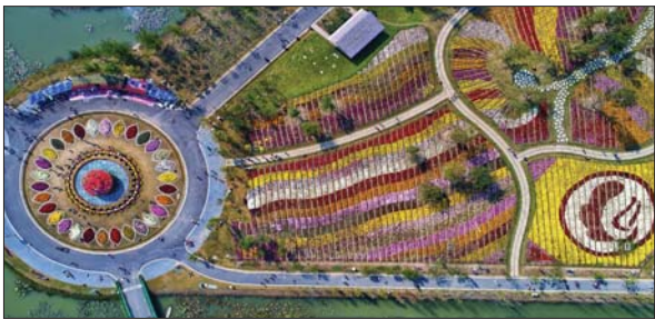
白马湖森林公园“菊世无双”菊花展。