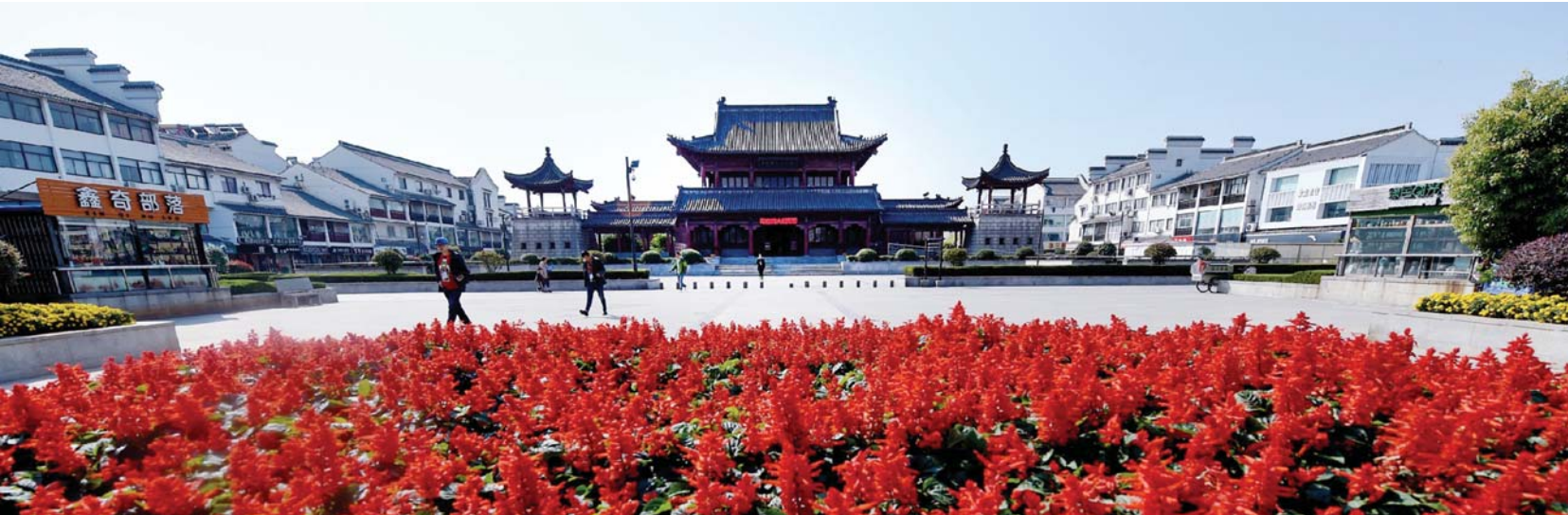
博物馆“红了”。