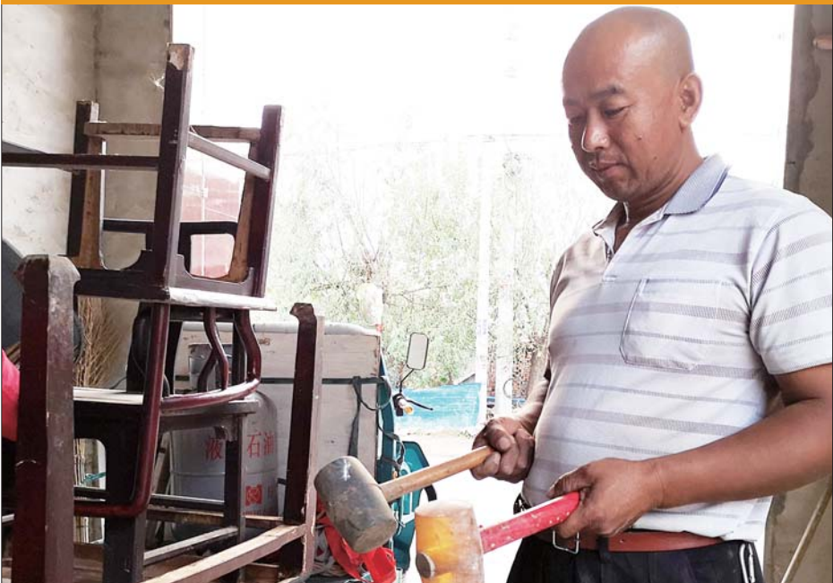
这干活的工具可不能丢。